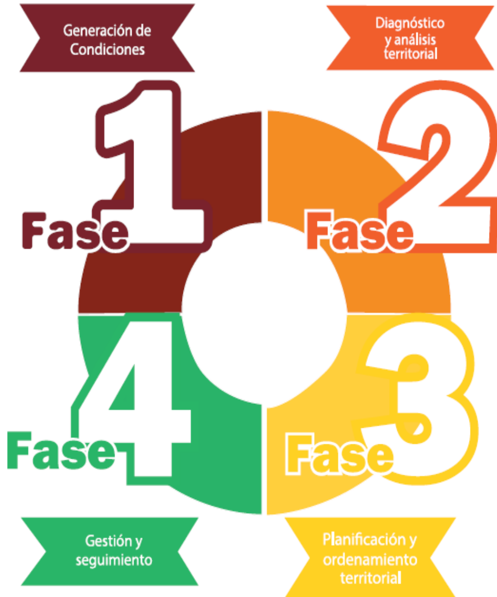
Figura 2. Fases PDM-OT

Fuente: SEGEPLAN. (2018). Guía para la elaboración del PDM-OT .