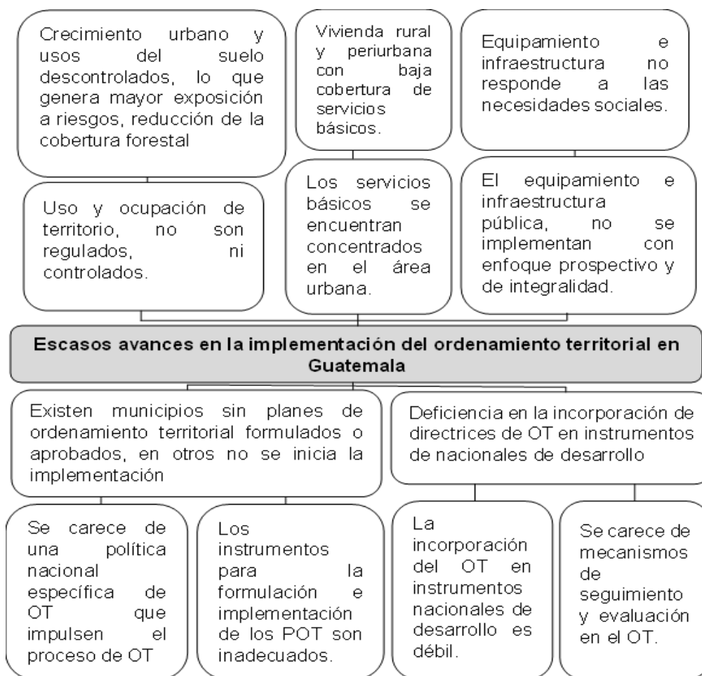
Figura 1. Árbol de problemas